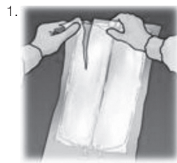
Abbildung 2: Zusammendrücken oder Rollen des Clinimix Beutels

Die Umverpackung vom oberen Rand her aufreißen