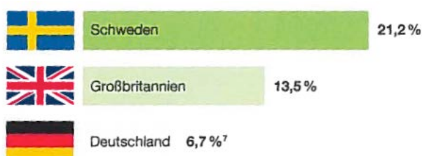
Abbildung 1: Verteilung der PD in Europa (modifiziert nach USRDS Annual Data Report 2016; Volume 2, Figure 13,15)

Im Rahmen der Presseveranstaltung „ Möglichkeiten und Chancen der Peritonealdialyse: Ein zeitgemäßes Therapieverfahren erhält die Lebensqualität “ diskutierten nephrologische Experten das große brachliegende Potenzial der PD und darüber hinaus die neuen Möglichkeiten, die sich durch die Kopplung des Verfahrens mit der Telemedizin eröffnen.